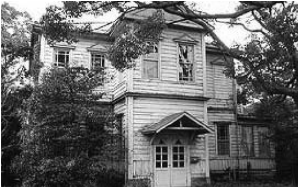
② 明治32年に設立された南湖院の第一病舎