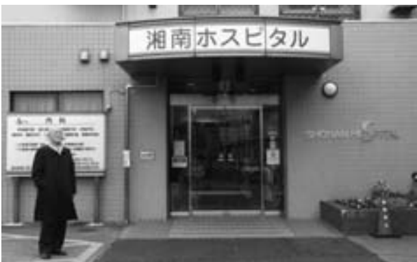
⑥ 長谷川病院 (現湘南ホスピタル) にて