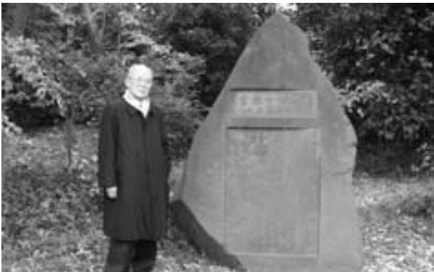
④ 現太陽の郷の庭にある南湖院を創設した高田畊安の碑