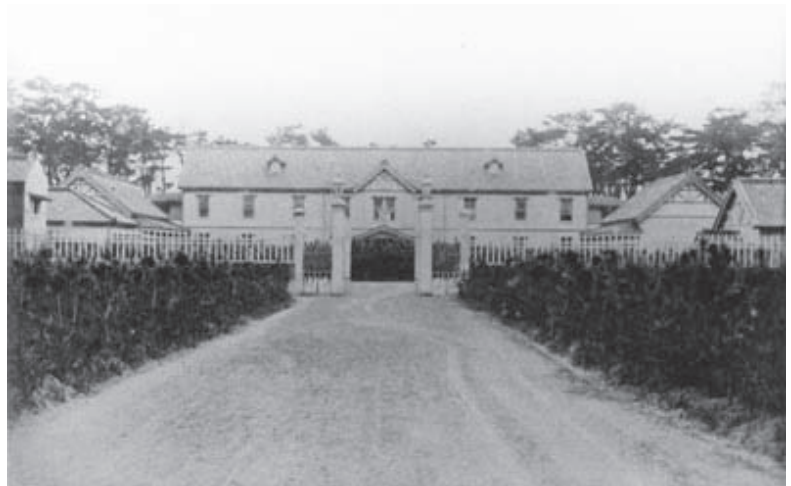
① 明治26年頃の鎌倉海浜院

この中で、南湖院は最初は5千坪強の土地から発足し、最後には5万坪の土地に総病床数200床強の施設に発展し、東京の医科大学の学生が施設見学にくるなど、診療の他に医学教育にも貢献している施設であった。しかし、入院料は昭和14年に一番安い病床でも1日3円であり、1カ月入院すると100円弱かかり、大學出の初任給が100円くらいであったことを考えると、庶民には長く入院することは困難であったと思われる。杏雲堂、南湖院とも本院は東京市内にあり、院長は双方兼務で往復をしておられたので、東海道線は開通していたとはいえ、今ほど道路事情や自動車も便利でない時代に、さぞ大変だったろうというのが現地を訪れた実感であった。湘南地方では、清瀬で見られたような、地元の土地取得に対する反対運動もなかったようで、明治のこの頃には、結核に対する差別、偏見はなかったのであろうか。(島尾記)