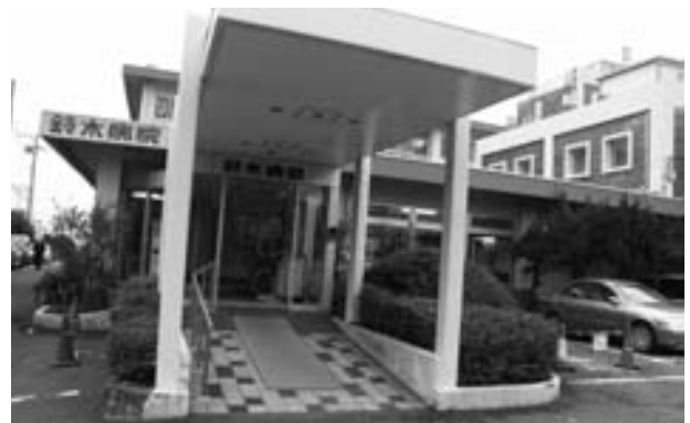
⑦ 鈴木療養所 (現鈴木病院) にて