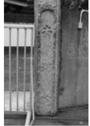
⑤ 現太陽の郷の門柱の裏側 (かつての南湖院の門柱が向きを変えて使われていた)