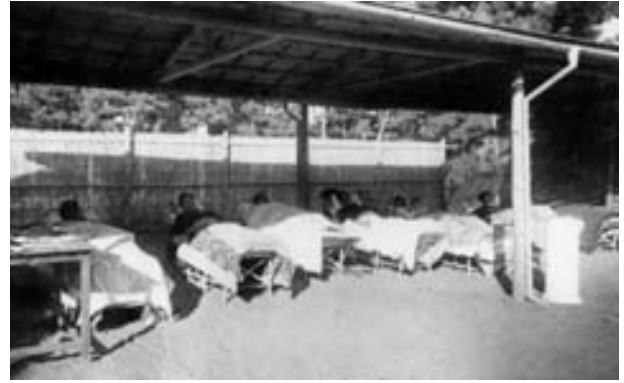
③ 南湖院の「戸外静臥」風景 (大気横臥所)