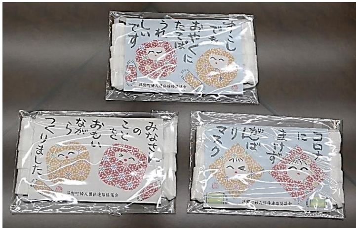
写真1 メッセージ付きの布マスク

末現在で集計しました。実施した団体は 11 あり、布マスク作り（写真 1）や、消毒ボランティア、「寺子屋」活動、医療用帽子作り（写真 2）、フードバンクなどがあがっていました。