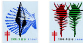
複十字シール 両りとも郵便から受取のため

1968年(昭和43年)第17回複十字シール運動を実施。今回から運動期間を8. 1~12. 31に変更、現在に至る。 募金額:17, 496万円