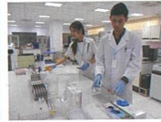
センターでの検査の様子