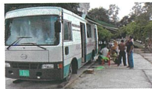
センターの移動レントゲン車