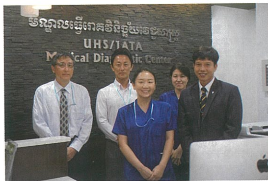
センターのメンバー。日本人看護師が常駐している

日本では法律で雇用主が社員に健康診断を受けさせることが義務化されていますが、この国ではほとんど実施されていません。しかし、大切な社員の健康を守ることは、どの