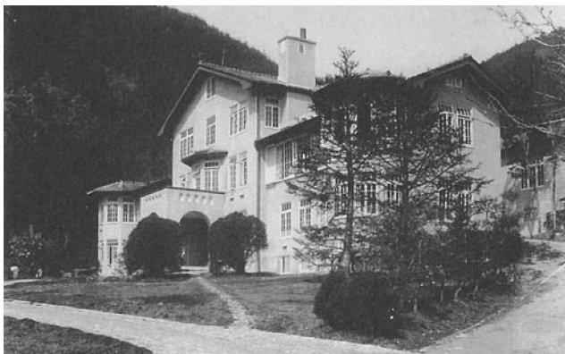
図1 近江療養院・本館

1915（大正4）年7月、国から設置命令が出ると、東京市は反対運動を恐れ別荘地と偽って土地の買収を進める。用地の目途が立った翌年6月に療養所の建設が周辺住民に知らされると、候補地の豊多摩郡野方村はすぐに建設反対を決議し、以降は村民一丸となり反対運動を繰り広げた。結局、最後はお互いに妥協しこの反対運動を終息へと向かわせるが、東京市に土地を売った一部村民は村八分の扱いを受けるなど住民間の確執は続いた。また療養所周辺の野菜類は買い手がつかないほどの風評被害も受けている。療養所の反対運