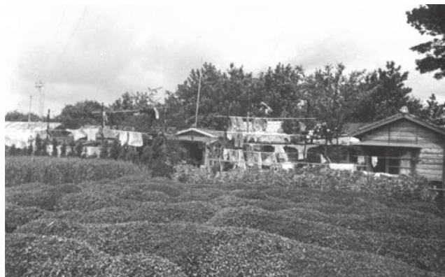
図3 茶畑に囲まれたベテルホーム 注) 聖隷歴史資料館所蔵

青木純一『結核療養所反対運動を通じた社会意識に関する研究』平成17年～19年度科学研究費補助金研究成果報告書、2008年。